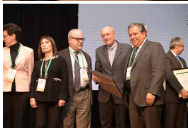
Figura 2. Reconocimiento a los Ex Presidentes de la ALAT

Esta reunión internacional se inició con 10 cursos pre-congreso, todos de alto nivel, a los que asistieron 508 profesionales. Se destacaron el curso de neumología intervencional y el de cirugía VATS ("video-assisted thoracoscopic surgery") Unipuerto.